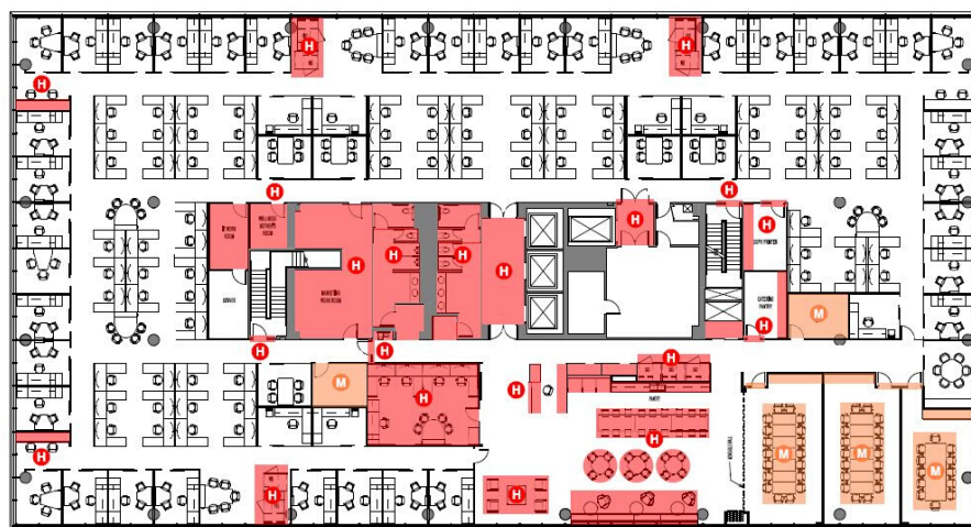
Vynačení rizikových míst v kanceláři. (H-vysoké riziko, M-střední riziko, X – riziková křižovatka)

Upozorňujeme, že tento dokument nemá za cíl stanovovat individuální normy ani identifikovat konkrétní povinnosti, které se vážou na jednotlivá pracoviště.